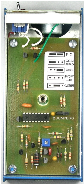
ТАБЛИЦА ВЫБОРА ЖИВОТНЫХ ДЛЯ PREG-TONE® 6-ОЙ СЕРИИ